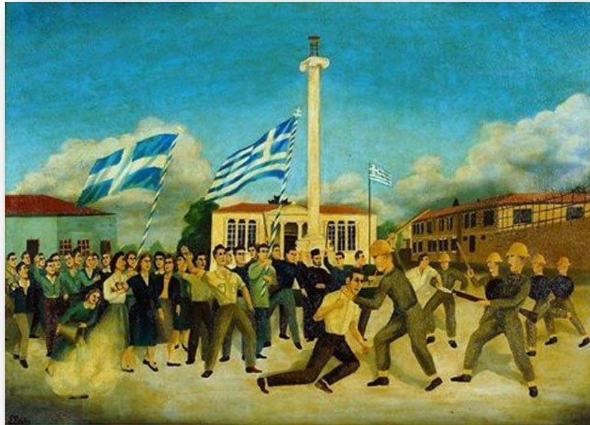
Εκπαιδευτικό Υλικό, ΥΠΠΑΝ Κύπρου

Κάθε επέτειο της 1 ης Απριλίου κάνουμε παρελάσεις και εορτασμούς. Φέτος έχουν ακυρωθεί όλες οι παρελάσεις και οι γιορτές, γι' αυτό ας κάνουμε τη δική μας παρέλαση στο σπίτι και να τραγουδήσουμε!